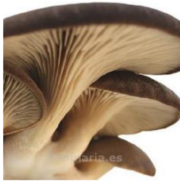
Setas de Cardo